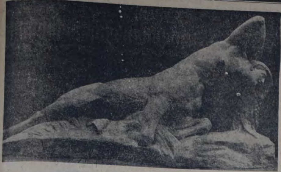
L. DE MONARD — LA AGONIA DE LA CENTAURA