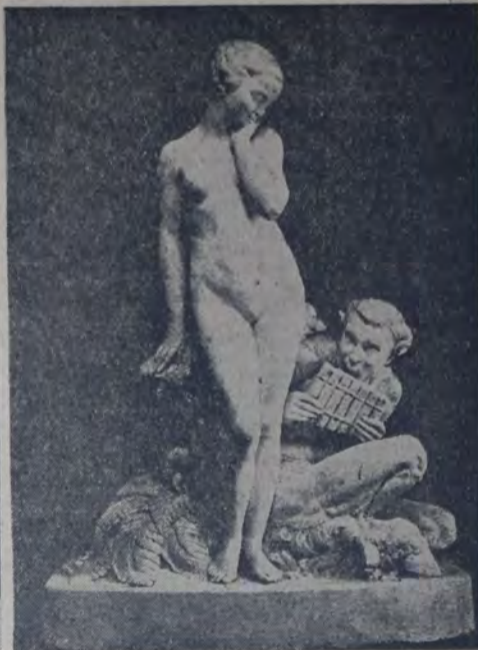
CHARTIER — PRIMAVERA