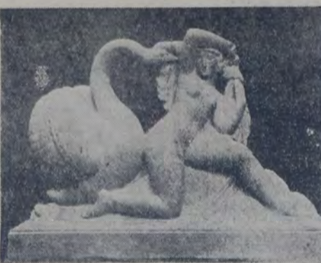
ORLANDINI — LEDA